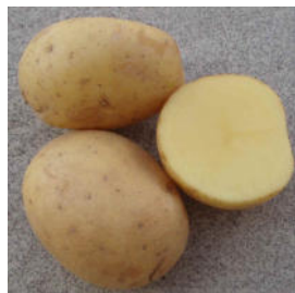
PATATE PASTA GIALLA